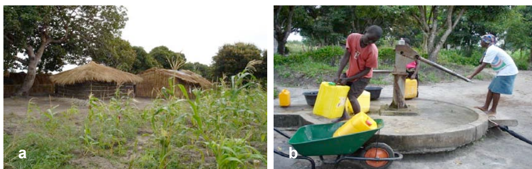
Figura 2 – a) Bairro dos arredores da cidade da Beira, com pequenas hortas de subsistência (“machambas”). b) Poço superficial de abastecimento público equipado com bomba manual (“dingo”).

O abastecimento de água é feito por poços superficiais (Fig. 2b) e furos até 40 m de profundidade, com excepção da zona central da cidade, abastecida por água captada no rio Púnguè, a cerca de 60 km a norte. Captam o aquífero multicamada, livre a semi-confinado, instalado na Fm Dondo e na Fm Mazamba, pouco produtivo devido a espessas intercalações argilosas. Os caudais variam entre os 0,7-1,6 m 3 /h. O nível freático é muito superficial, entre 1 a 7 m de profundidade, no final da época seca. A maioria das águas é do tipo cloretada sódica, com pouco oxigénio dissolvido (0,8-3,4 mg/L), pH ácido (5,14-6,43) e Eh de -0,85 a 270 mV. A lavagem de roupa junto aos poços justifica os compostos de degradação dos detergentes (Octilfenol e Nonilfenol) detectados e a forte correlação (R=0,94) entre o B e PO 4 . Os solos são fertilizados com cinzas, pelo que a concentração do NO 3 é baixa. Não foram encontrados organismos patogénicos.